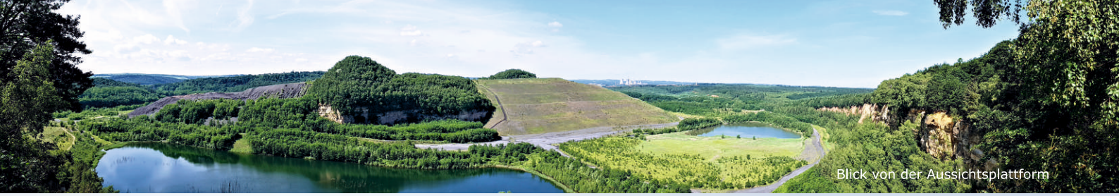
Blick von der Aussichtsplattform